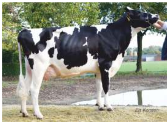
майка: Paultje 91 ET