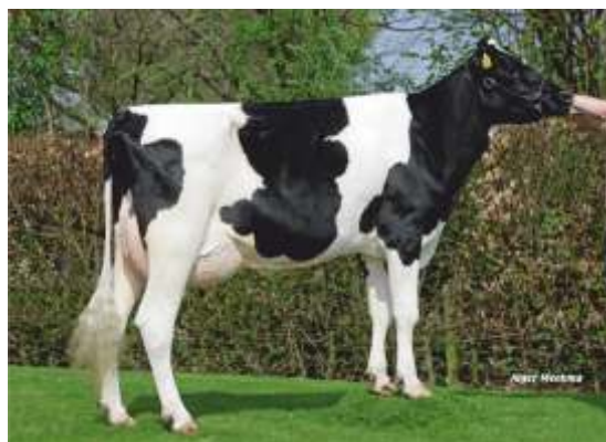
дъщеря: Jeanneke 157